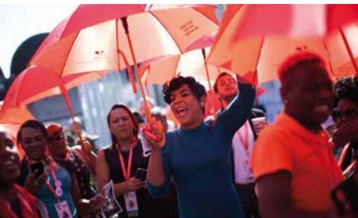
Секс-работни_цы выступают за улучшение законов и условий труда у здания, где проходит Международная конференция по СПИД в Дурбане, Южная Африка, июль 2016 года.

Данные анализа ТММ показывают, что мигрант_ки составляют значительное число среди убитых транс и гендерно вариативных людей в Европе. Из 122 транс и гендерно вариативных людей, убитых в Европе с января 2008 года, 39 человек, то есть 32% всех жертв, были мигрант_ками. В некоторых странах, таких как Италия, более двух третей жертв зарегистрированных убийств были мигрант_ками. Из 32 транс и гендерно вариативных людей, чьи убийства были задокументированы в Италии, 22 человека, то есть 69% жертв, были мигрант_ками (16 из Бразилии). Из 6 задокументированных убийств во Франции, 4 жертвы, то есть 67%, были мигрант_ками. Жертвы 6 из 9 задокументированных убийств в Испании, то есть 67%, были мигрант_ками. Жертвой единственного задокументированного убийства в Португалии в 2008 году был_а мигрант_ка из Бразилии. Итого, в четырёх южноевропейских странах (Франция, Италия, Португалия и Испания), куда мигрирует большая часть транс и гендерно вариативных людей из Африки, Центральной и Южной Америки, 33 из 48 жертв задокументированных убийств, то есть 69%, были мигрант_ками.