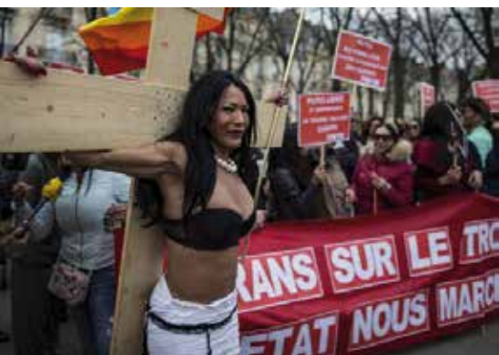
Транс мигрант_ки и активист_ки из организации Acceptess Transgenres выступают против криминализации клиентов в Париже, Франция, 2016 год.