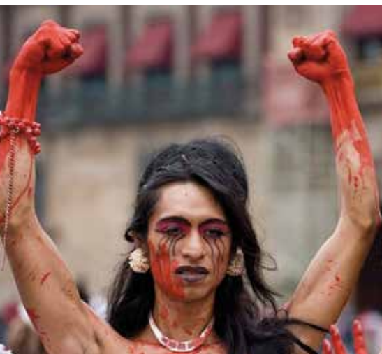
Транс активист_ки в Мексике протестуют против насилия в отношении ЛГБТ людей и секс-работни_ц, 13 августа 2011 года.