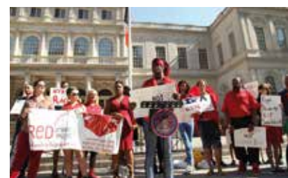
Митинг у здания Суда по пресечению торговли людьми, август 2015 года.