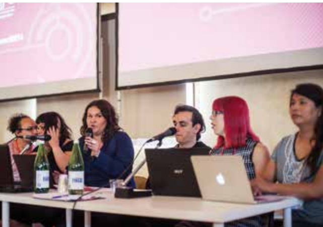
бй Европейский трансгендерный совет в Болонья, Италия, 2016 год — мероприятие по включению секс-работни_ц в транс движение

Мы признаём, что наш анализ вряд ли можно назвать исчерпывающим, так как в нём мы использовали главным образом данные из онлайн и офлайн англоязычных источников, а также данные и результаты исследований, накопленные нашими партнёрскими организациями. Поэтому мы надеемся, что общественные группы, исследователь_ницы и активист_ки будут дополнять, развивать и даже ставить под сомнение представленные здесь результаты.