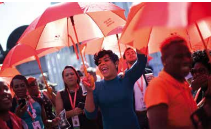
Trabajadorxs sexuales protestando por mejores leyes y condiciones de trabajo en las afueras de la Conferencia Internacional sobre el SIDA en Durban, Sudáfrica, julio de 2016.