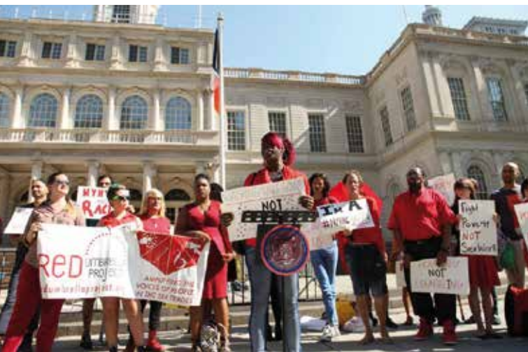
Proyecto Red Umbrella, Rally de Intervención sobre Trata de Personas, agosto de 2015

Lxs trabajadorxs sexuales trans enfrentan estigmas y discriminaciones interseccionales debido a que su estatus de persona trans y trabajadorx sexual se junta a otros factores influyentes que incluyen racismo, misoginia, capacitismo, clasismo y xenofobia. Muchxs de ellxs son impactadxs por la discriminación de vivienda, alta vigilancia, y falta de acceso a la justicia, servicios de salud y beneficios sociales, debido a que el trabajo sexual no es reconocido como un trabajo en sus países respectivos. Los siguientes capítulos ilustrarán diferentes aspectos de la marginalización y sus interconexiones en varios contextos.