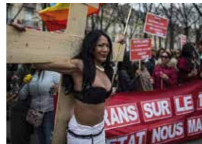
Activistas trans migrantes de Acceptess Transgenres protestando contra la criminalización de clientes en París, Francia, en 2016.

Hoy en día, varios países tienen leyes que criminalizan, por ejemplo, la homosexualidad y el llamado cross-dressing. En Sudán, por ejemplo, leyes que prohíben vestimentas consideradas indecentes o inmorales han sido utilizadas para castigar a las personas percibidas como hombres que utilizan “ropas de mujer,” además de personas percibidas como mujeres que utilizan pantalones y modelos masculinos que utilizan maquillaje. 40 En Nigeria, las leyes relacionadas con vestimentas indecentes han sido utilizadas para multar y encarcelar a las personas percibidas como hombres que realizan “cross-dressing.” 41 En Guyana, de acuerdo a la sección 153 de la Ley de Jurisdicción Sumaria (Ofensas), es un crimen cuando “un