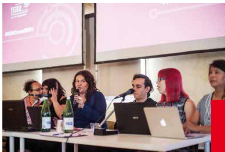
6° Consejo Europeo Trans, Bolonia, Italia, 2016 – Taller sobre la inclusión de trabajadorxs sexuales en el movimiento trans

Sabemos que nuestro análisis está lejos de ser comprehensivo, utilizando principalmente evidencia disponible de fuentes en inglés online y offline, además del conocimiento e investigación acumulados de nuestras organizaciones colaboradoras. Esperamos que grupos comunitarios, académicxs y activistas por la justicia social complementen, desafíen y construyan en base a los hallazgos presentados en este documento.